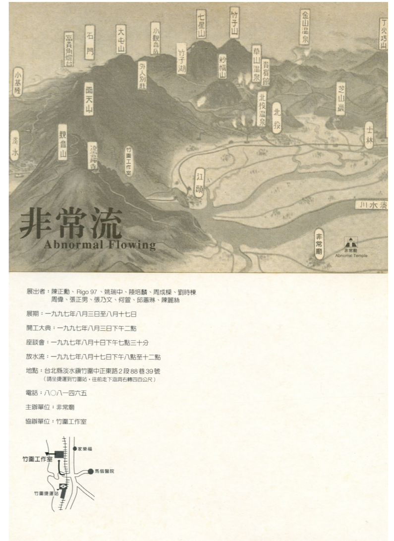
1997年在竹圍工作室舉辦的「非常流」。

1996年我自空軍退伍後蟄居蘆洲，因無所事事、一心創作，當時思考單打獨鬥無法長遠，於是號召北藝大第八屆同學（大多是登山社成員）一起成立團體，因為住在蘆洲長安街162巷後面有間慈惠堂，索性就叫「非常廟」，剛好當時在三芝有一棟廢紡的偉新紡織廠（最早由張力山作為創作基地），後來學弟在那裡做了一檔實驗性展覽「交互·作用」，我們退伍剛好那批學弟要去當兵，於是接手在1997年3月成立「非常廟」，招牌寫在一塊爛木板貼在廢墟廠房門口，舉辦了首次聯展「末世漫遊」，展覽反應還不錯，所以就繼續打游擊、辦聯展。